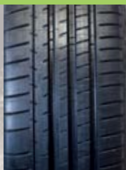
Michelin Pilot Super Sport Pris* 2 600 kr