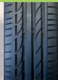
Bridgestone Potenza S001 Pris* 2 300 kr