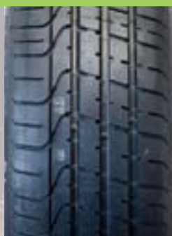
Pirelli P Zero Pris* 2 300 kr