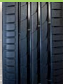
Nokian Z G2 Pris* 2 000 kr